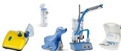
Membran-Vernebler, Ultraschallvernebler, Vernebler mit Schall-Vibration insbesondere für Nasennebenhöhlenentzündung