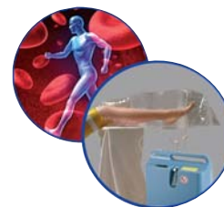
Wundheilung mit Sauerstoff O2-TopiCare Wundsystem