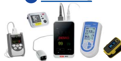
Pulsoxymetrie, Kapnographie, SISS Babycontrol Blutdruckmessung