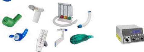
GeloMuc / Flutter / Quake / Cornet / Cornet Plus / Acapella / IPPB Atemtherapie RespiPro / PowerBreathe medic