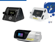
CPAP/autoCPAP/ BiLevel/BiLevel ST/Cheyne Stokes