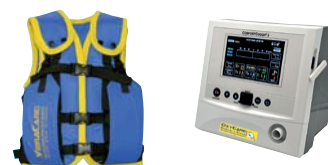
VibraVest Die hochfrequente Vibrations-Weste, Comfort Cough II Hustenassistent optional mit HFCWO